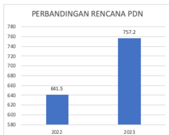
Gambar 2. Perbandingan rencana Produk Dalam Negeri